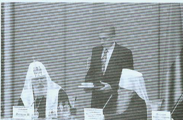
Его Святейшество Патриарх Московский и всея Руси Алексий II, Митрополит Минский и Слуцкий, Патриарший экзарх всея Беларуси Филарет, Р.С. Мотульский