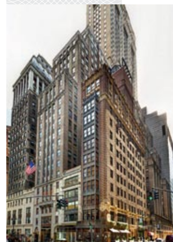
Library Hotel – отель-библиотека в Нью-Йорке