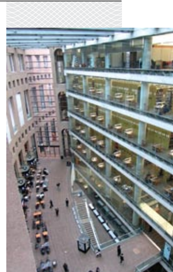
Центральное отделение библиотеки Ванкувера