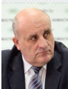
Василий Мечиславович ЧЕРНИК – заместитель министра культуры Беларуси

Б. БОБРОВА: Да, люди ходят в библиотеки. Охват библиотечным обслуживанием у нас в Могилевской области остается